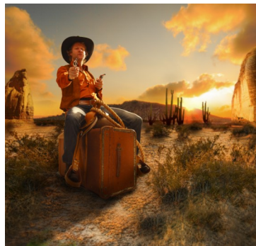
Uit de voorstelling Billy the Kid

taal, verbeelding en cultuur bij kinderen te stimuleren. Via de vertelkunst, live muziek en theaterspel maakt het jonge publiek kennis met de rijkdom van taal, muziek en spel.