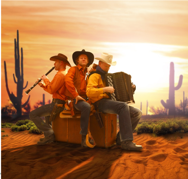
Uit de voorstelling Billy the Kid